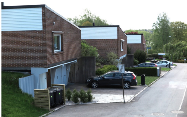
Rött tegel och slutna fasader.