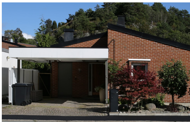
Carport med slät, vit sarg.