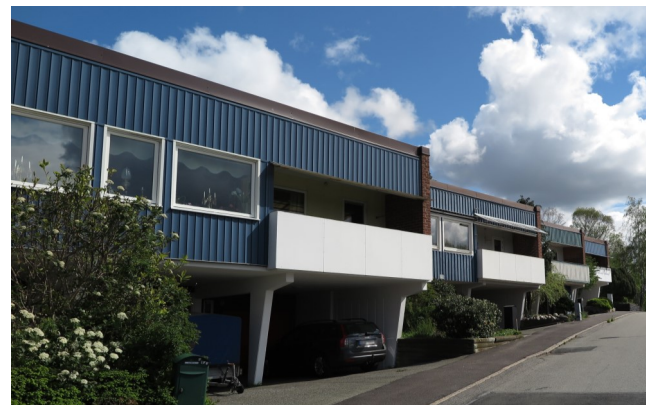
Vita släta balkongfronter, enhetlig färg på takplåtar och blåa fasader.

Friggebodar, tillbyggnader och andra ändringar ska utformas så att bebyggelsens karaktärsdrag och enhetlighet inte förvanskas. Det är viktigt att tillägg smälter in och tar hänsyn till befintlig bebyggelse när det gäller placering och utformning. Utgå från de ursprungliga materialen, färgerna och de flacka pulpettaken.