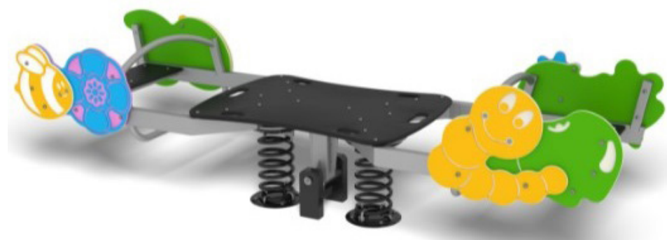
Hags gungbräda Modell 'Springtime'