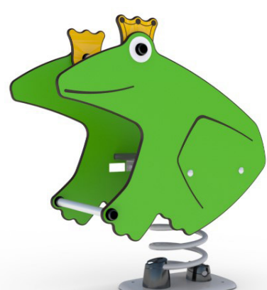
Hags Gungdjur Modell 'Prinsy'