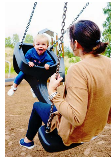
Hags Duo-sits 'Tango'