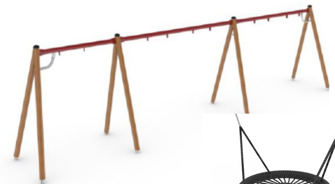
Hags 5-sits Gungställning med plats för: Kompis + Baby + Duo + enkel