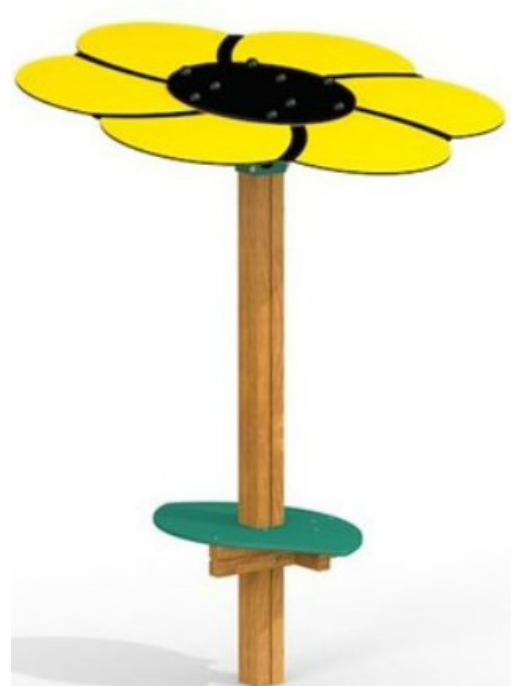
Tress Sandbaktbord med skugg-tak.