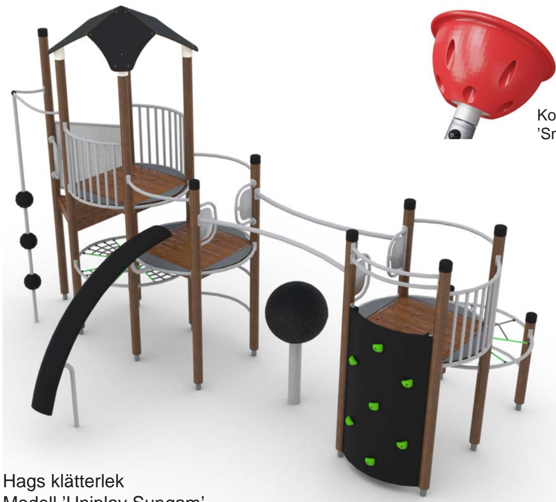
Kompan snurrlek 'Snurrkopp'